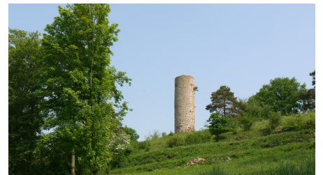
Heinturm