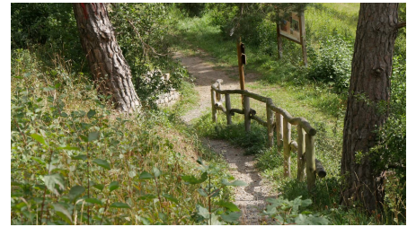
Pfad am Heinberg