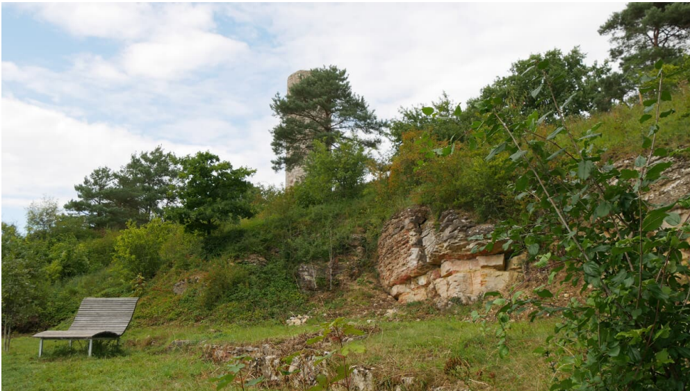
Landschaftsliede am Heinberg