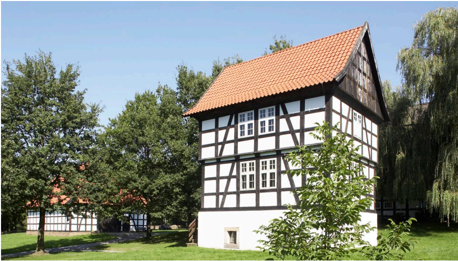
Museumshof Bad Oeynhausen im Siekertal