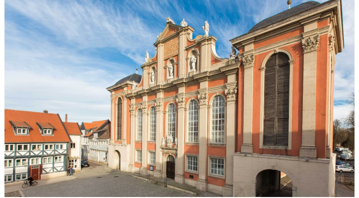
St. Trinitatiskirche