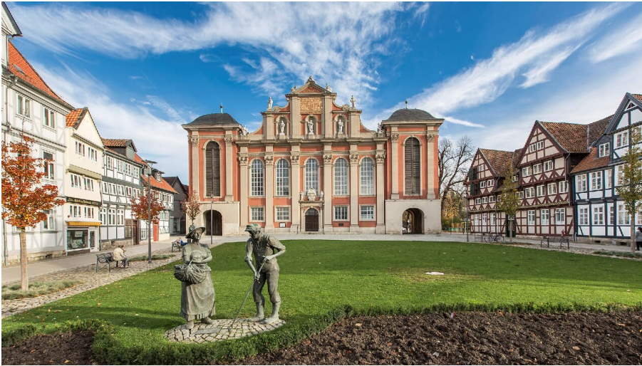
St. Trinitatiskirche