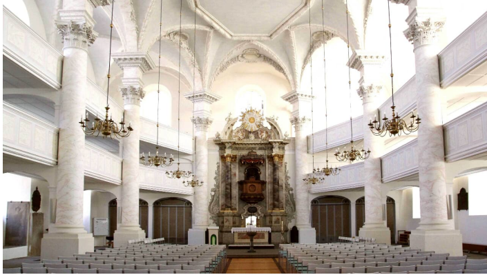
St. Trinitatiskirche von innen