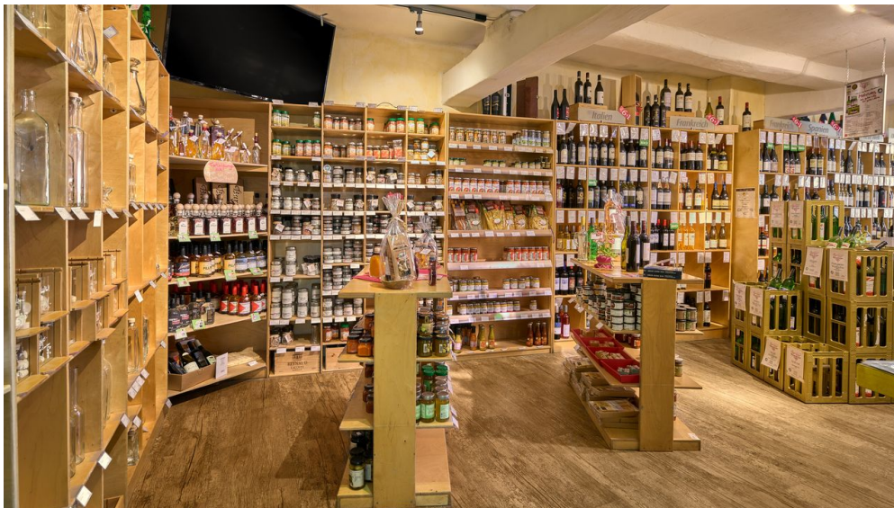
Barrique - © Anna Meurer