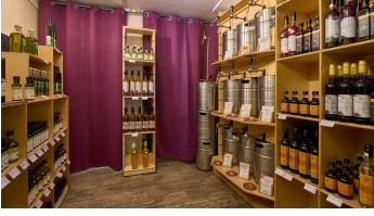
Barrique - © Anna Meurer