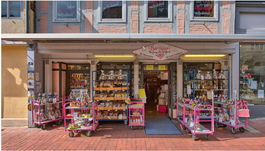
Barrique Außenansicht