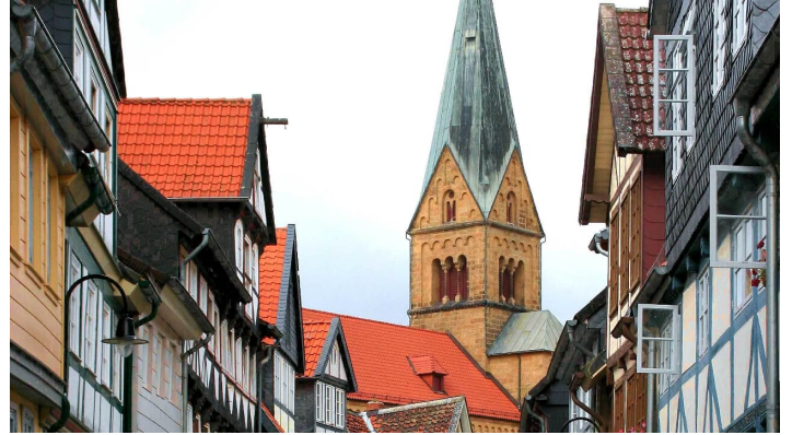
St. Petruskirche