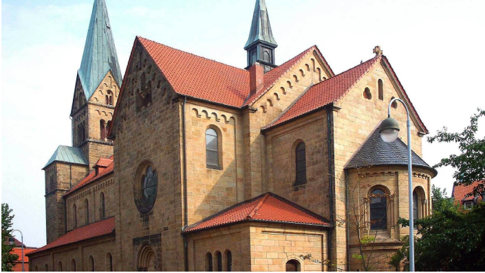
St. Petruskirche