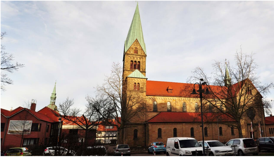
St. Petruskirche