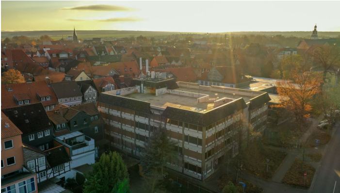
Parkplatz Parkhaus Rosenwall-1

Mo - So 06.00 - 23.00 Uhr auch an den Feiertagen