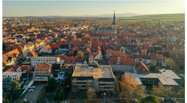
Parkplatz Parkhaus Rosenwall-2