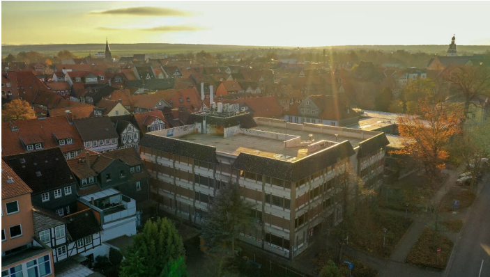
Parkplatz Parkhaus Rosenwall-1

Mo - So 06.00 - 23.00 Uhr auch an den Feiertagen