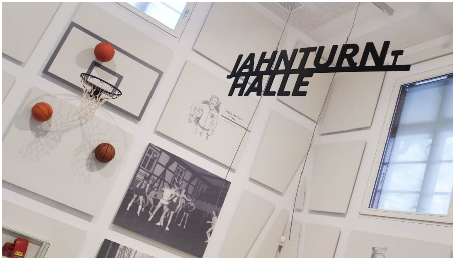
Bürger Museum in der ehemaligen Jahnturnhalle