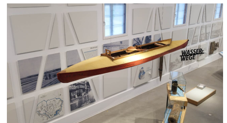
Bürgerliches Leben in der Stadt - © Stadt Wolfenbüttel