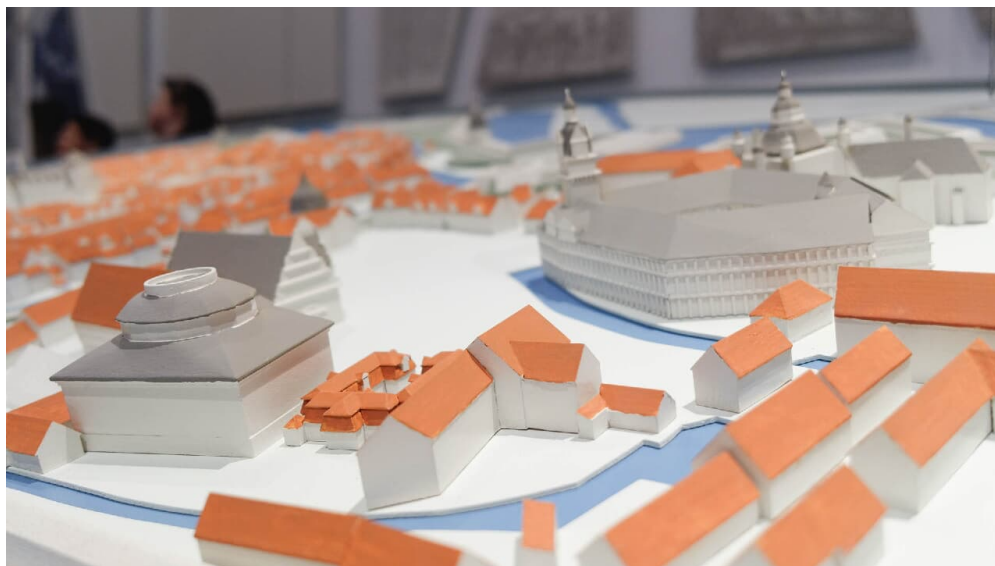
Stadtgeschichte zum Anfassen