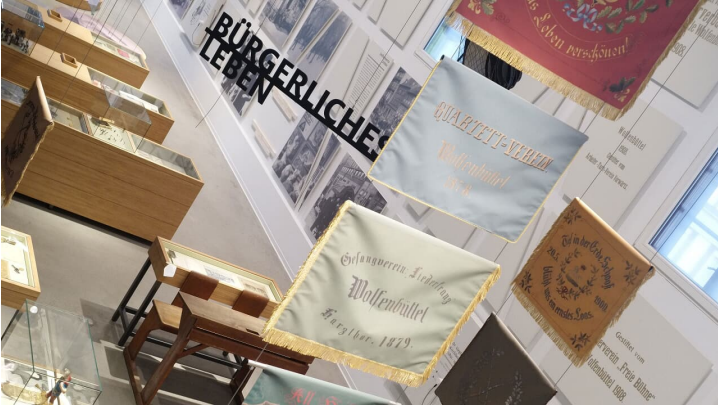
Bürgerliches Leben in Wolfenbüttel