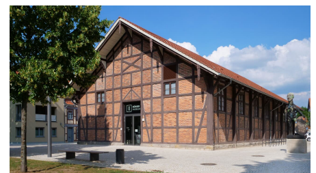
Außenansicht des Bürgermuseums - © Stadt Wolfenbüttel