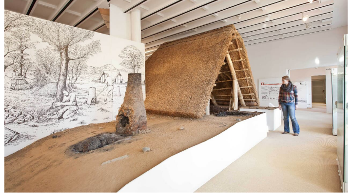
Archäologie in der Kanzlei