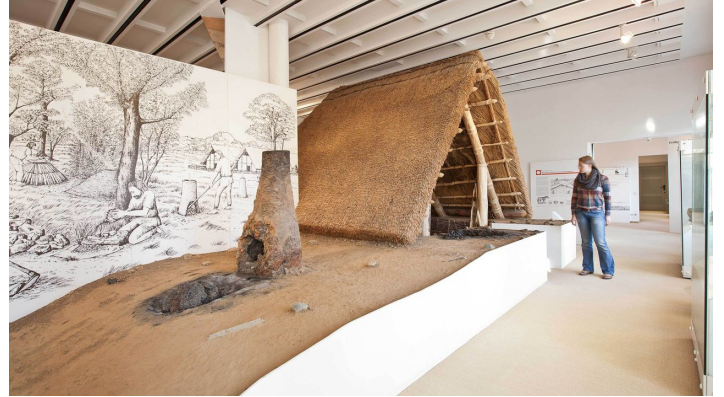
Archäologie in der Kanzlei