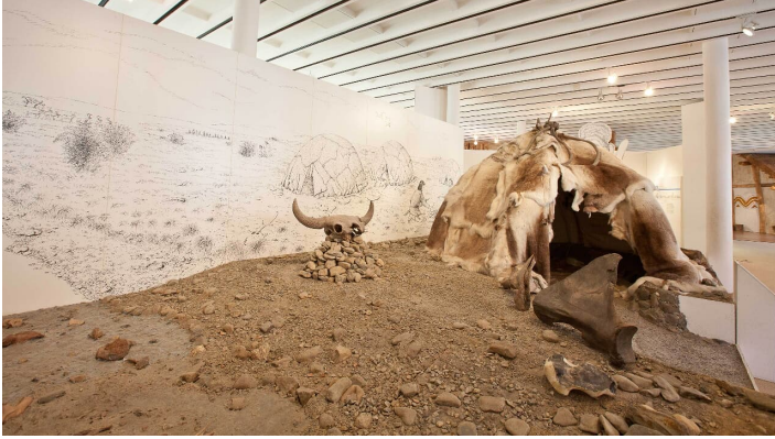
Archäologie in der Kanzlei

Das Braunschweigische Landesmuseum Archäologie, Standort Wolfenbüttel, ist zur Zeit geschlossen, die Ausstellung wird überarbeitet.