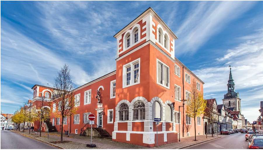
Ehemalige herzogliche Kanzlei