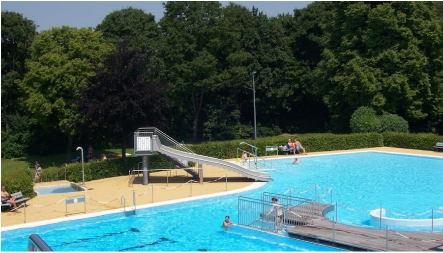
Freibad am Elm