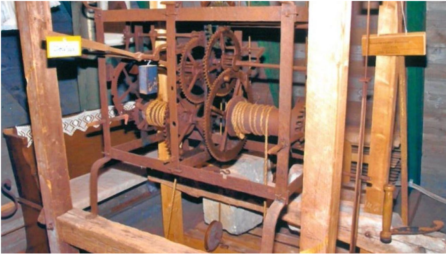
Kirchbodenmuseum der Christuskirche Weddel - © Elif und Wolfgang Delfs Kirchbodenmuseum der Christuskirche Weddel/W. Delfs