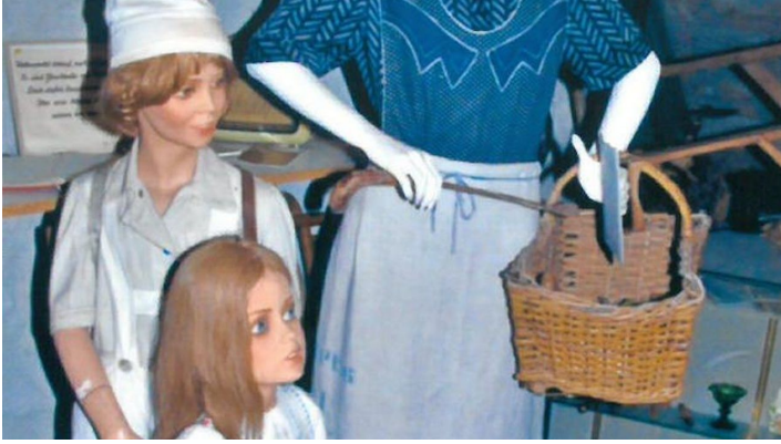
Kirchbodenmuseum der Christuskirche Weddel