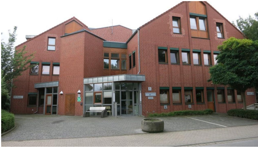
PHV-Dialysezentrum Bad Oeynhausen