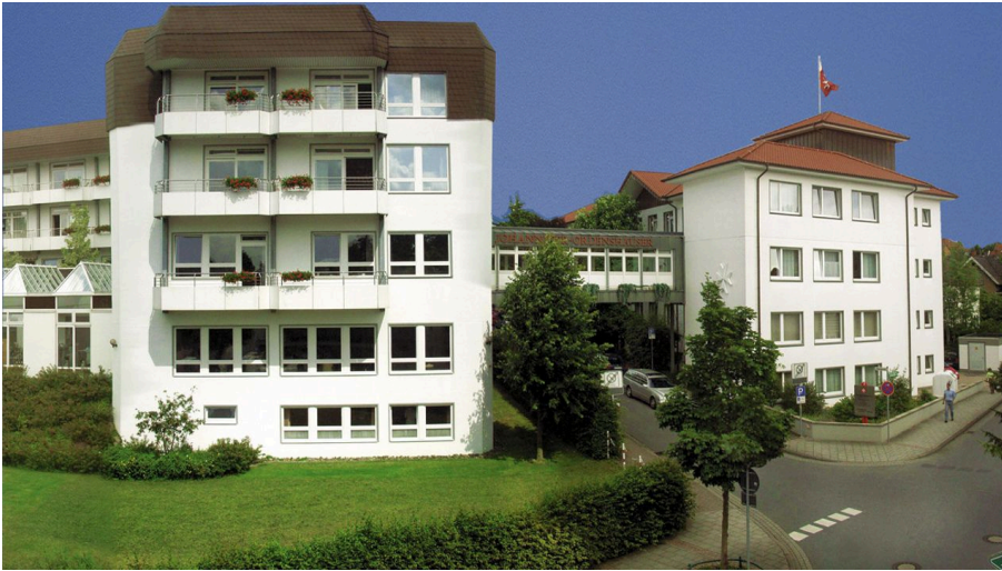
Johanniter Ordenshäuser Bad Oeynhausen