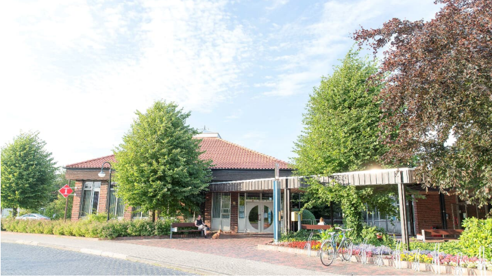
tourist information horumersiel