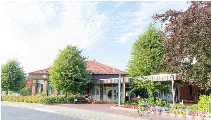
tourist information horumersiel