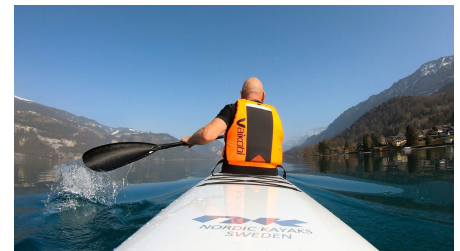
Surfskipoint Gunten