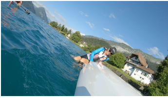
Surfskipoint, Interlaken Tourismus - web@interlaketourism.ch