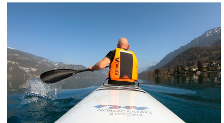
Surfskipoint Gunten, Interlaken Tourismus - web@interlaktourism.ch