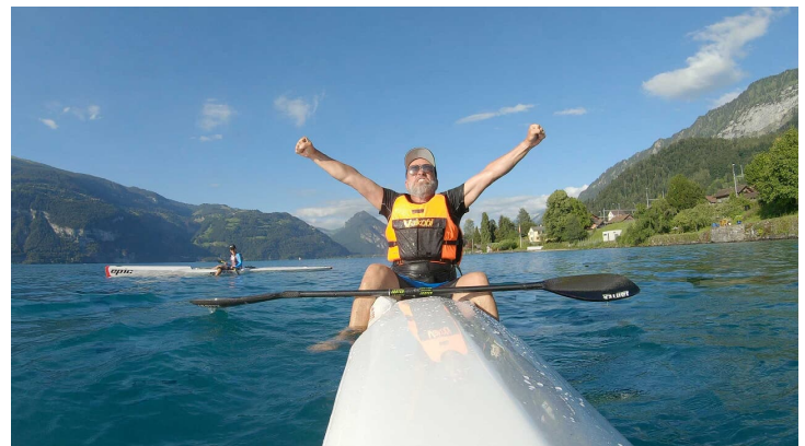
Surfskipoint, Interlaken Tourismus - web@interlaktourism.ch