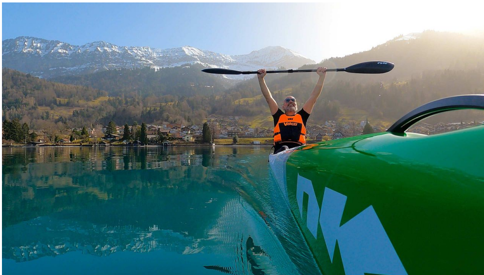
Surfskipoint, Interlaken Tourismus - web@interlaktourismus.ch