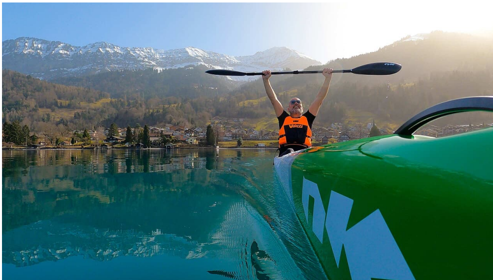
Surfskipoint, Interlaken Tourismus - web@interlaktourism.ch