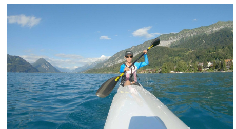
Surfskipoint