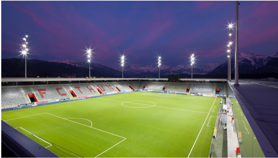
thun-stockhorn-arena-abendstimmung