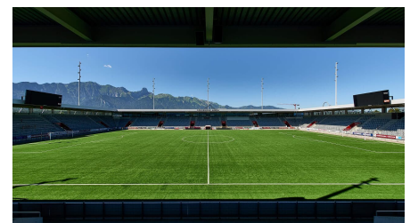
thun-stockhorn-arena-spielfeldmitte