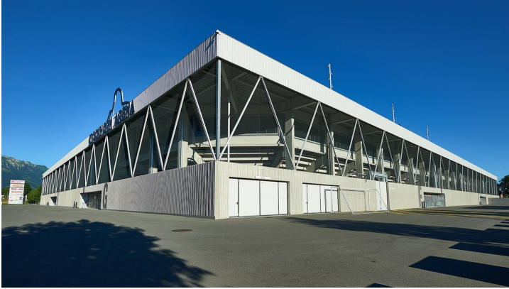
thun-stockhorn-arena-aussenansicht-vorplatz