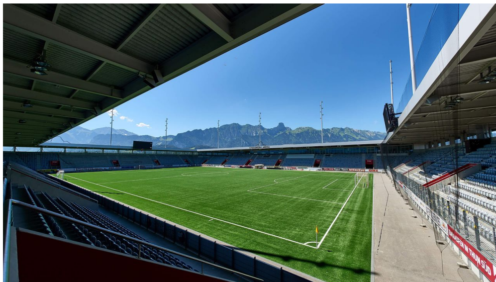
thun-stockhorn-arena-gaestesektor

Stadionführungen werden auf Anmeldung durchgeführt.