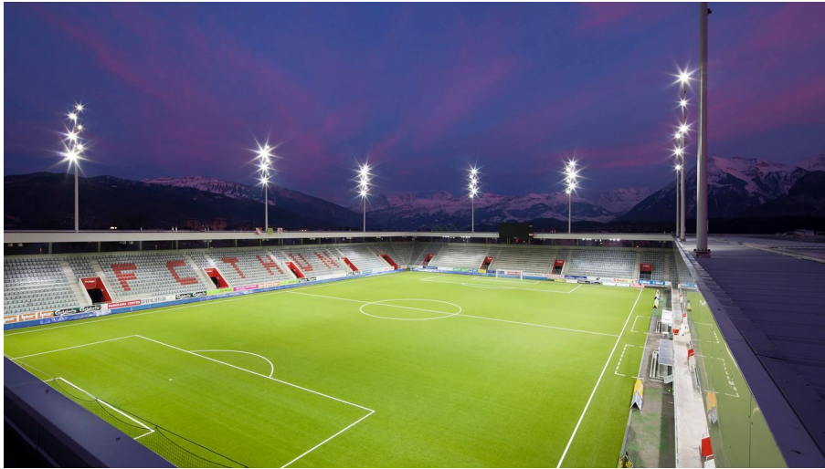
thun-stockhorn-arena-abendstimmung