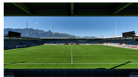
thun-stockhorn-arena-spielfeldmitte