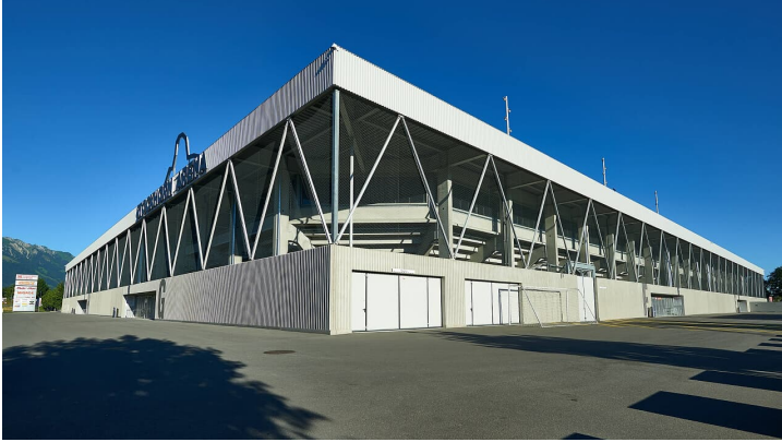
thun-stockhorn-arena-aussenansicht-vorplatz