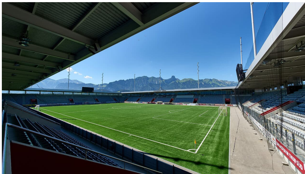
thun-stockhorn-arena-gaestesektor

Stadionführungen werden auf Anmeldung durchgeführt.