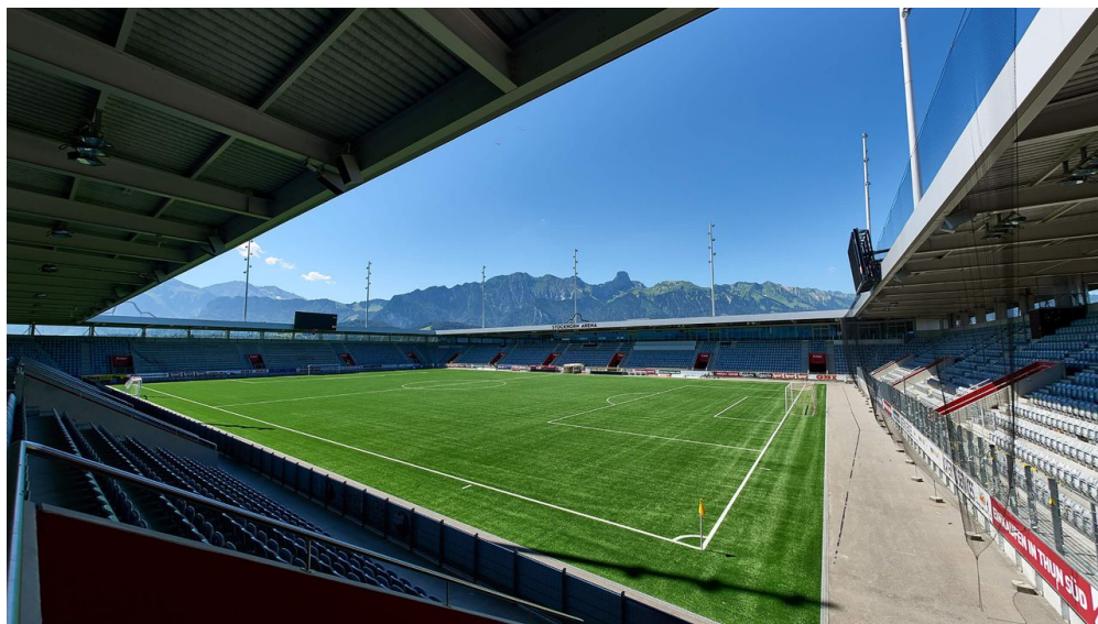
Stockhorn Arena

Des visites guidées du stade sont disponibles sur rendez-vous.