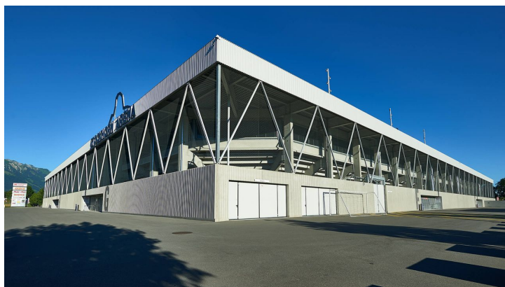
Stockhorn Arena