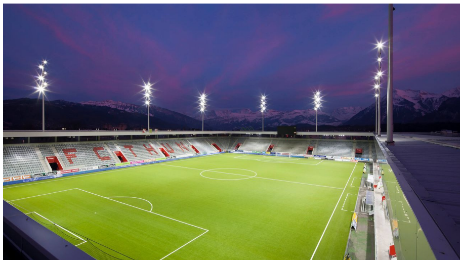
Stockhorn Arena