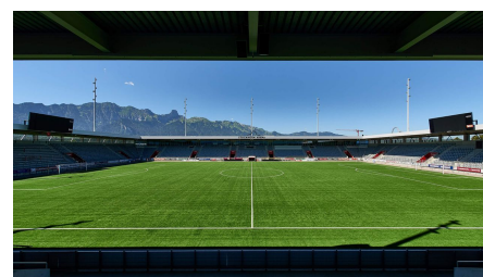
Stockhorn Arena