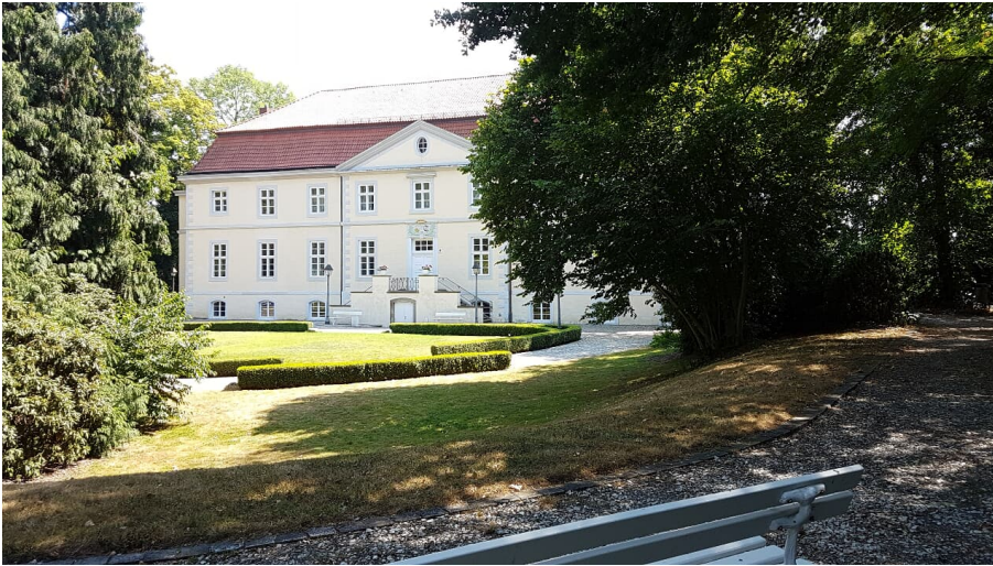
Schloss Ovelgönne