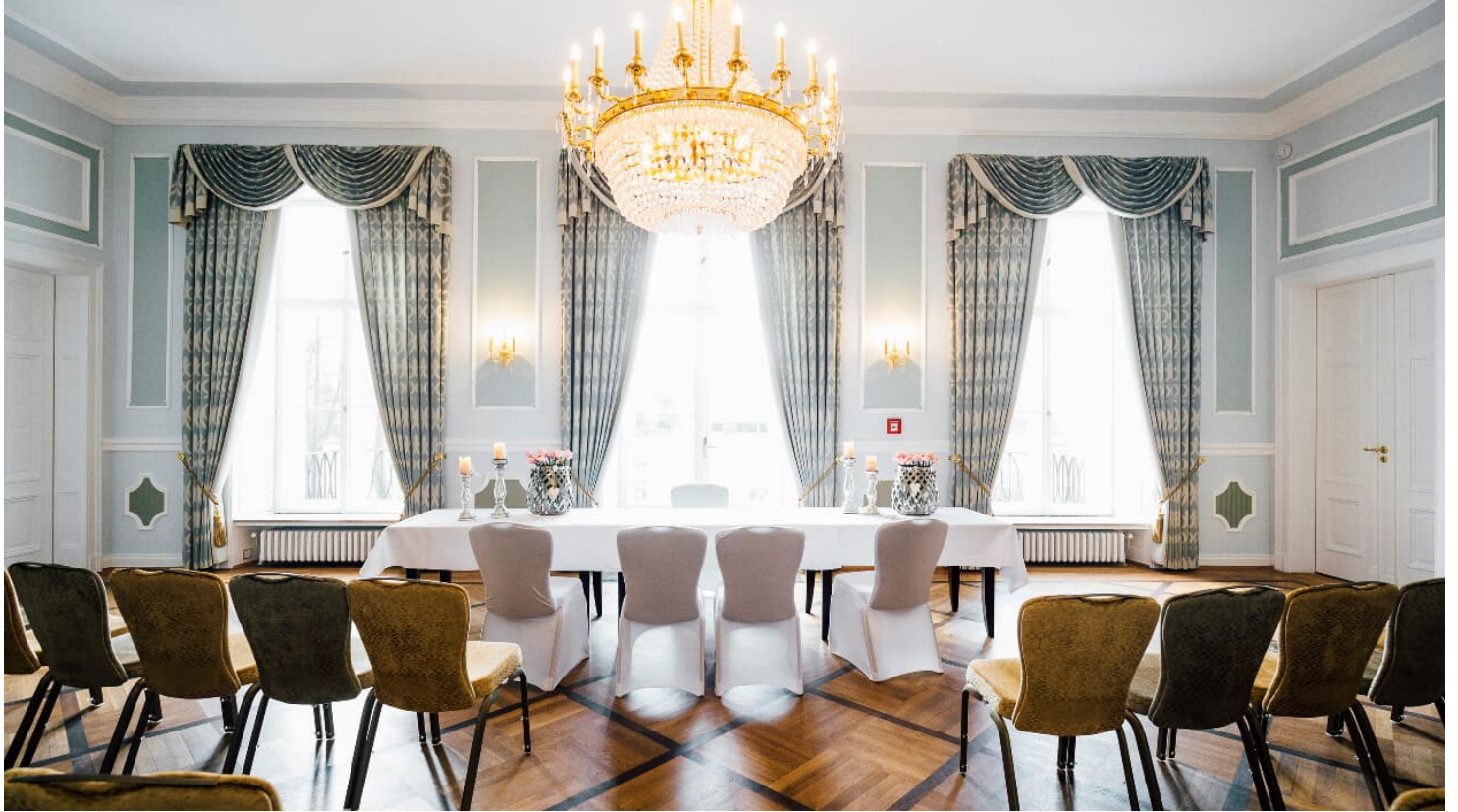
Schloss Ovelgönne