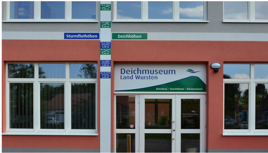
Deichmuseum.jpg - © Beate Ulich