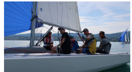
zürichsee-sommer-segeln