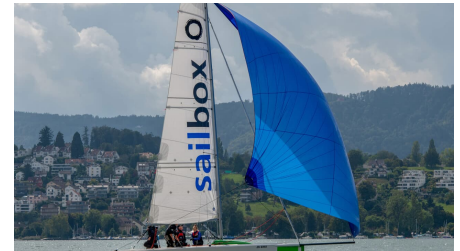
zürichsee-sommer-segeln-sailbox