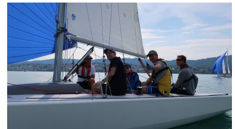
zürichsee-sommer-segeln