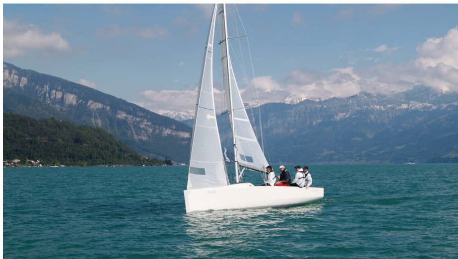
thunersee-sommer-segeln-berge-sailbox