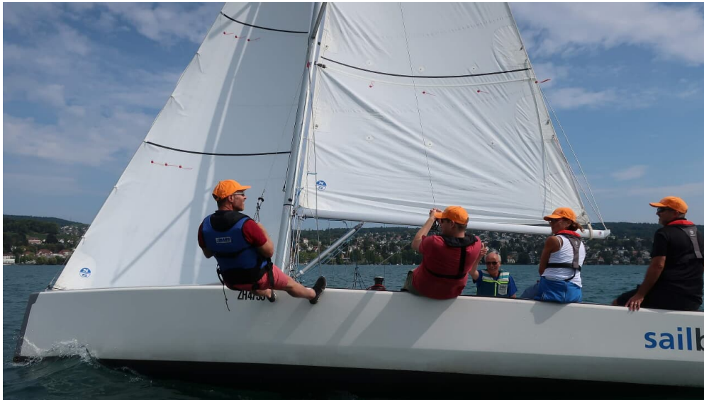
zürichsee-sommer-segeln-menschen

für jedes Wetter, für Gruppen, für Schulklassen