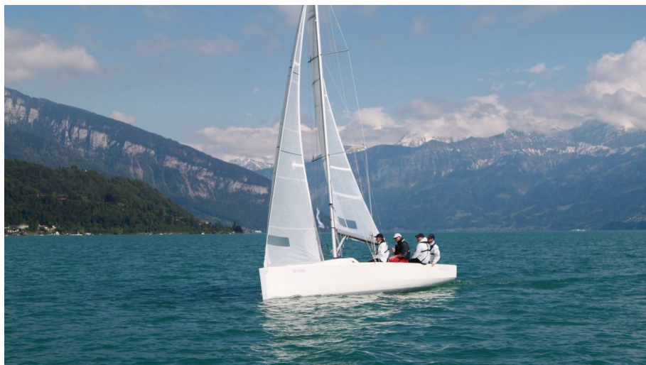
thunersee-sommer-segeln-berge-sailbox