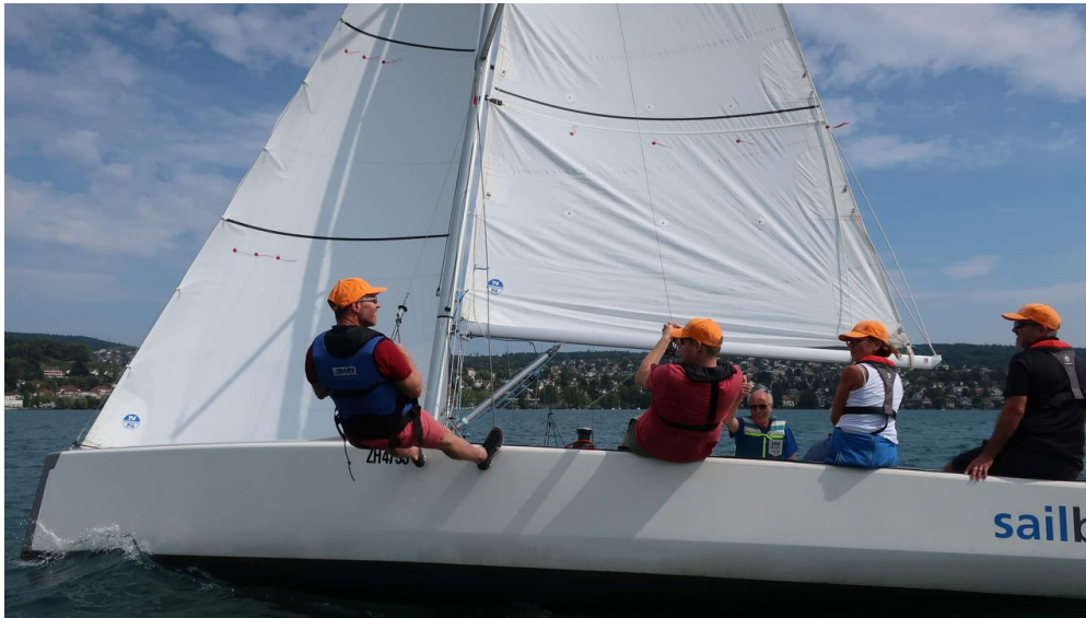
zürichsee-sommer-segeln-menschen

für jedes Wetter, für Gruppen, für Schulklassen