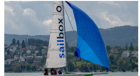
zürichsee-sommer-segeln-sailbox