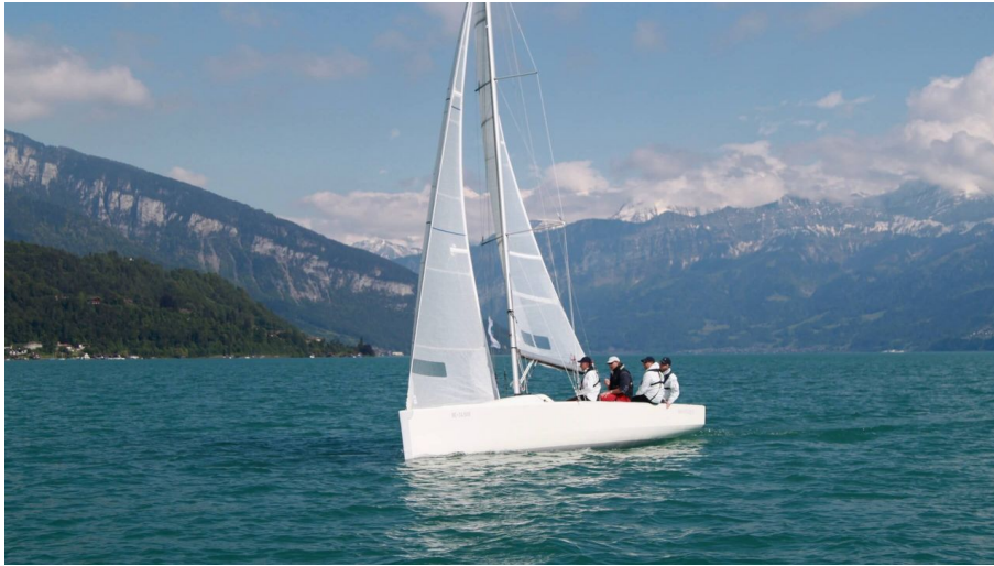
Sailbox – Boatsharing, Training & Events, Interlaken Tourismus - web@interlaketourism.ch