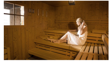
beatenberg-dorint-wellness-sauna.jpg