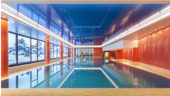
beatenberg-dorint-schwimmbad.jpg