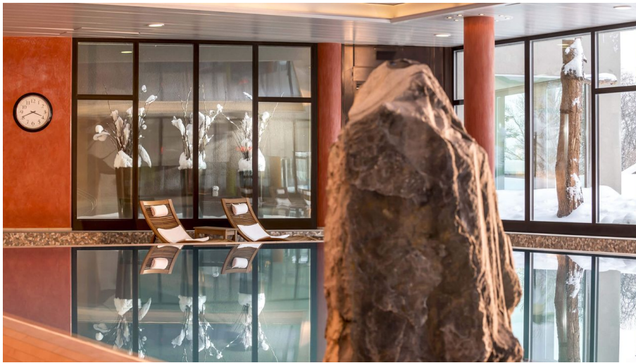
beatenberg-dorint-schwimmbad-stein.jpg