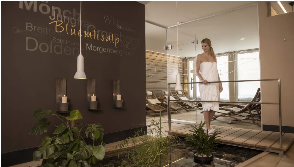
beatenberg-dorint-wellness-pflanzen.jpg