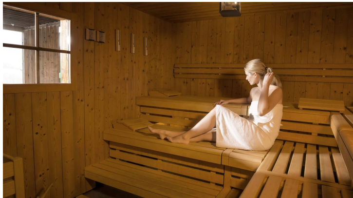
beatenberg-dorint-wellness-sauna.jpg