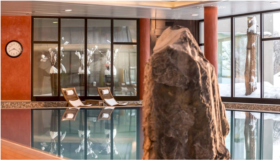
beatenberg-dorint-schwimmbad-stein.jpg