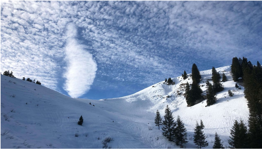
Schneeschuhtour im Diemtigtal