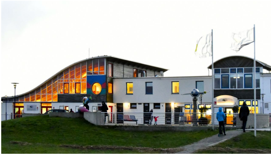
Gästezentrum Dorum-Neufeld mit anliegendem Kinderspielhaus