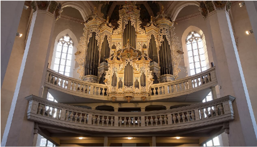
naumburg_Hildebrandt-Organ_c_stadt_naumburg_m_frauendorfer.jpg - © Manuel Frauendorf Fotografie