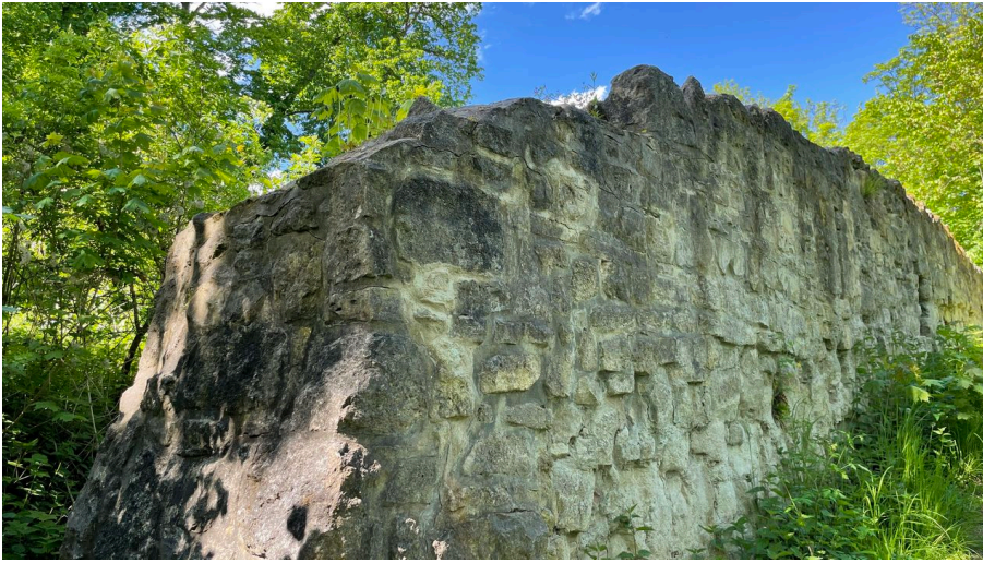
Asseburg Ruine IMG_5524.jpg - © Nhavo, Jessica Lau