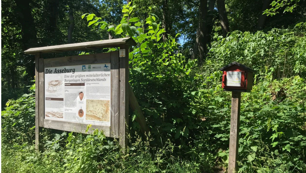
Stempelstation mit Infoschild Asseburg Ruine