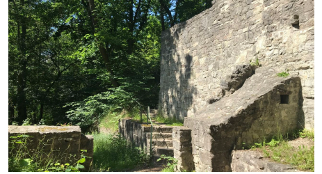
Asseburg Ruine_nördliches Harzvorland