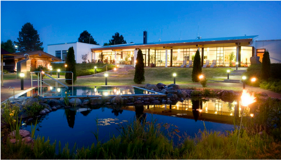
Saunalandschaft Sole-Therme