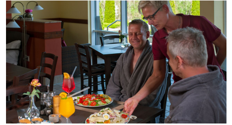
Saunalandschaft Otterndorf