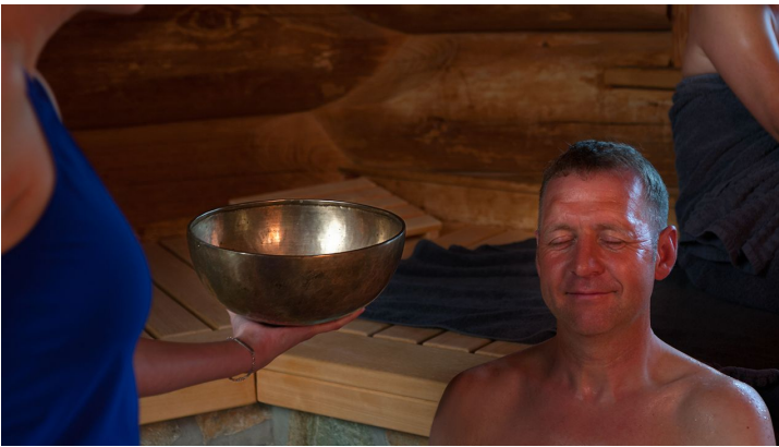
Saunalandschaft Otterndorf