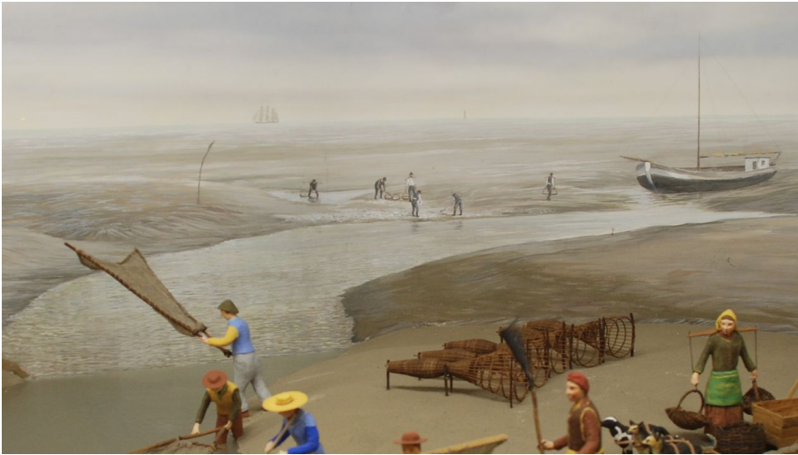
wattenfischereimus_wre_3.jpg - © Museum für Wattenfischerei