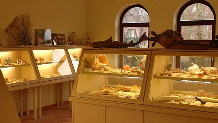
Die Ausstellung