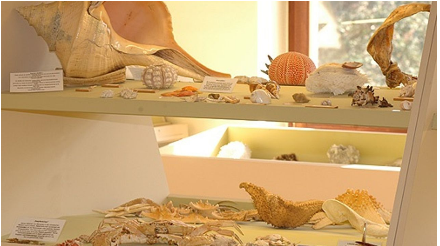
Muscheln aus aller Welt