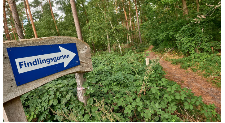
Achim Meurer_2020_Nördliches Harzvorland_GeoPark Findlingsgarten Königslutter am Elm