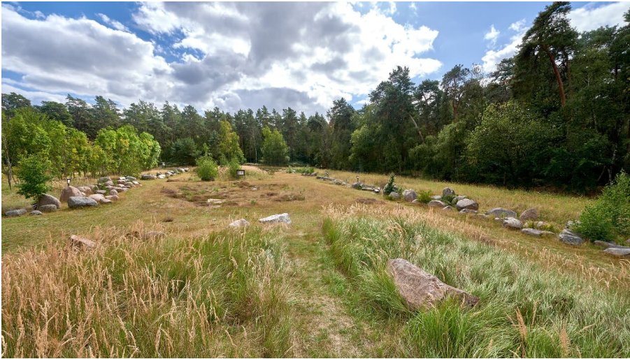
Achim Meurer_2020_Nördliches Harzvorland_GeoPark Findlingsgarten Königslutter am Elm - © @ Achim Meurer