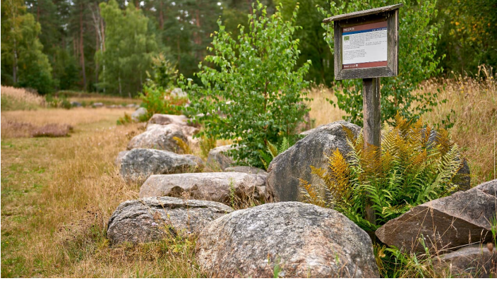
Achim Meurer_2020_Nördliches Harzvorland_GeoPark Findlingsgarten Königslutter am Elm - © @ Achim Meurer