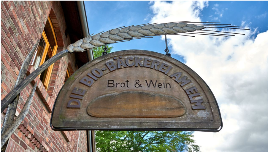
Die Bio-Bäckerei am Elm_Achim Meurer_2019_Nördlichen Harzvorland, Niedersachsen, Deutschland