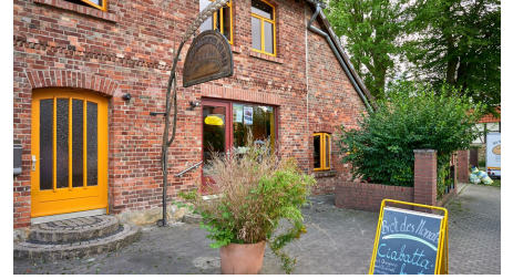
Die Bio-Bäckerei am Elm_Achim Meurer_2019_Nördlichen Harzvorland, Niedersachsen, Deutschland