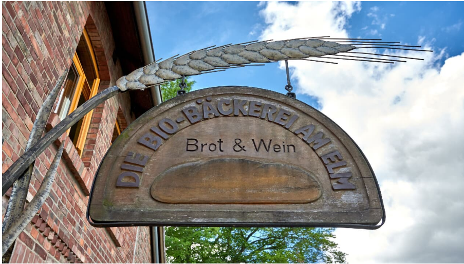
Die Bio-Bäckerei am Elm_Achim Meurer_2019_Nördlichen Harzvorland, Niedersachsen, Deutschland