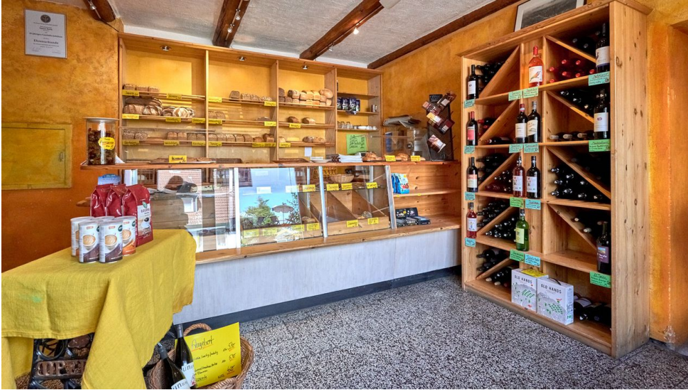
Die Bio-Bäckerei am Elm_AchimMeurer_2019_ Nördlichen Harzvorland, Niedersachsen, Deutschland