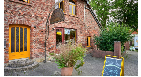
Die Bio-Bäckerei am Elm_Achim Meurer_2019_ Nördlichen Harzvorland, Niedersachsen, Deutschland - © Anna Meurer