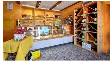
Die Bio-Bäckerei am Elm_Achim Meurer_2019_ Nördlichen Harzvorland, Niedersachsen, Deutschland