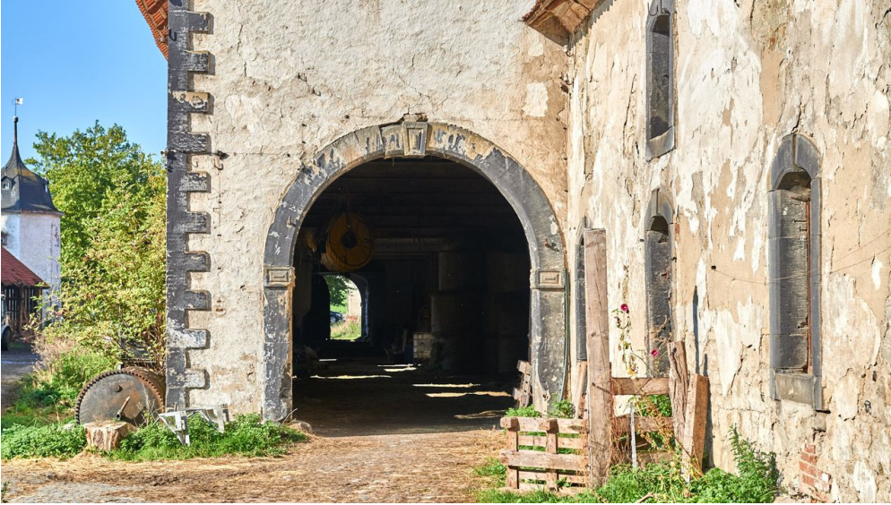
Der Demeter-Bauernhof im Klostersgut Heiningen mit seinen Tieren #nHavo