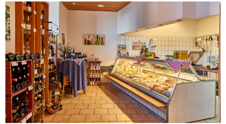
Die Käseerei auf dem Demeter-Bauernhof in Heiningen