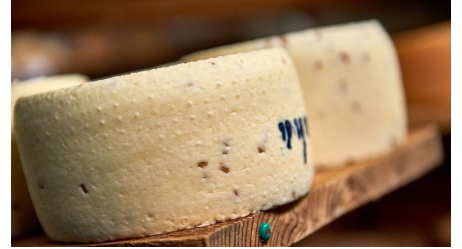
Die Käseerei auf dem Demeter-Bauernhof in Heiningen