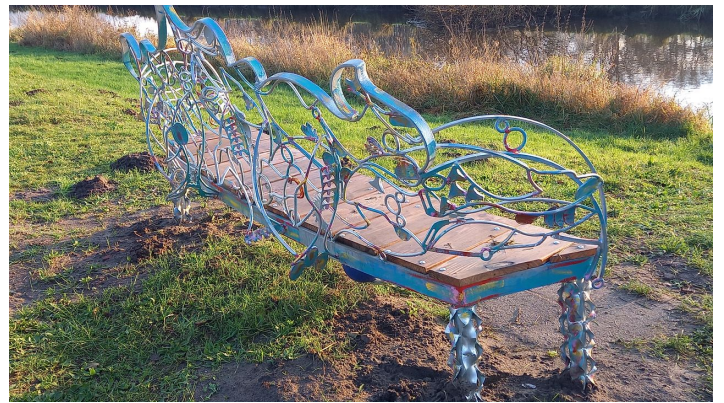
Fischbank am Lieblingsort Heeren Wehren Brücke