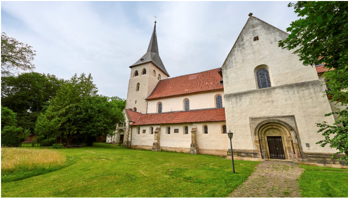
Kath Kirche Heiningen - © Anna Meurer