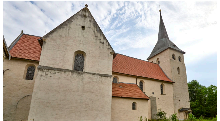
Kath Kirche Heiningen - © Anna Meurer