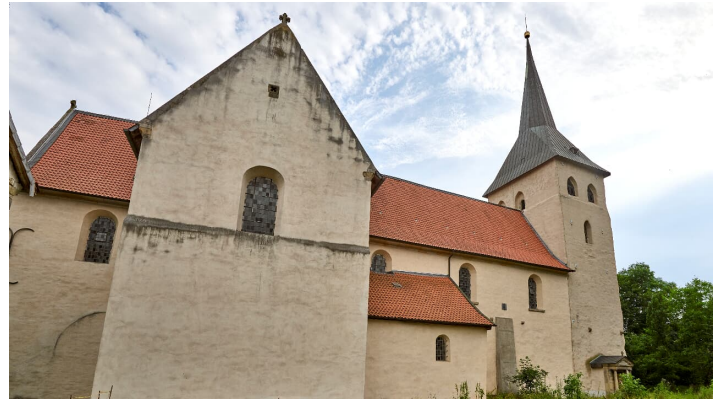
Kath Kirche Heiningen