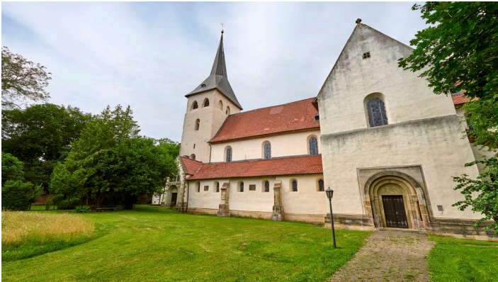
Kath Kirche Heiningen