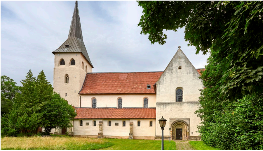
Kath Kirche Heiningen - © Anna Meurer