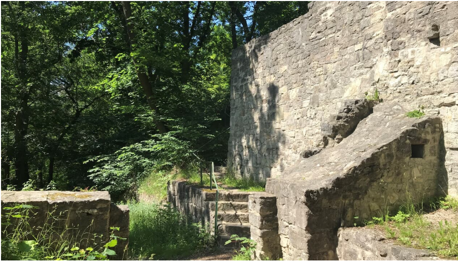
Asseburg Ruine_nördliches Harzvorland