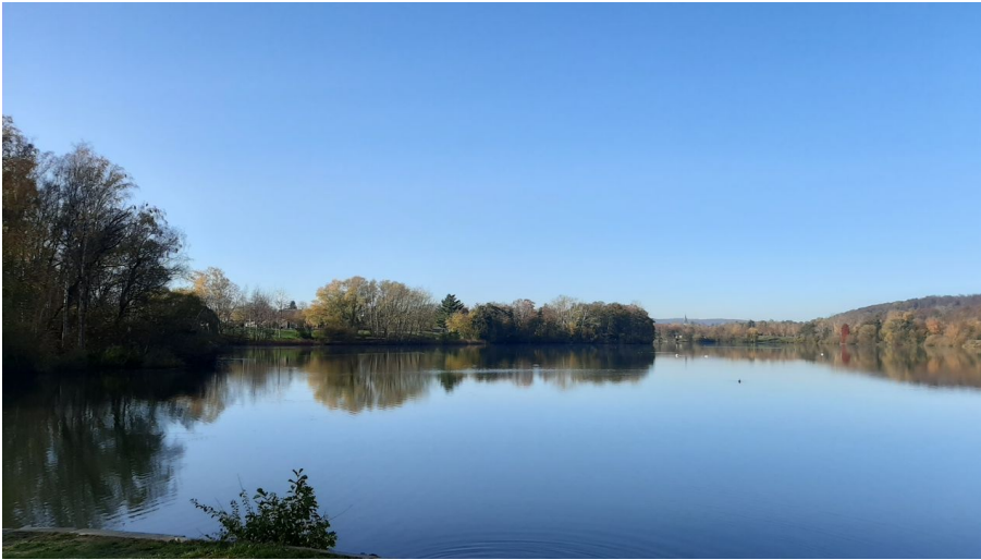
Vienenburger See_nördliches Harzvorland.jpg