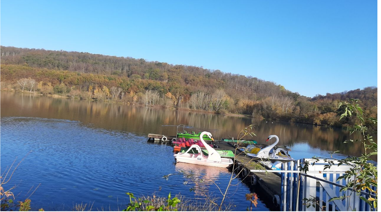
Vienenburger See_nördliches Harzvorland.jpg