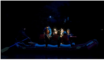
raclette-rafting-outdoor-interlaken-chillipictures-boot-nacht.jpg