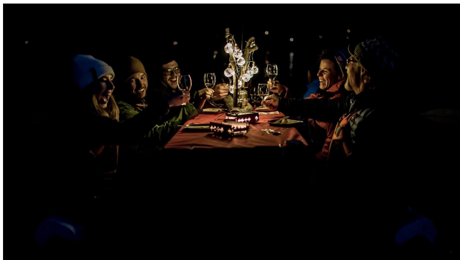
raclette-rafting-outdoor-interlaken-chillpictures-gesellschaft.jpg