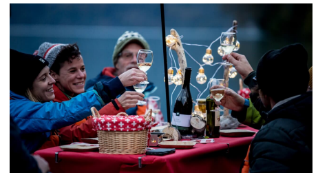
raclette-rafting-outdoor-interlaken-chillpictures-anstossen.jpg