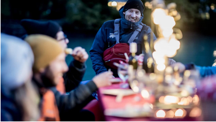
raclette-rafting-outdoor-interlaken-chillipictures-guide.jpg