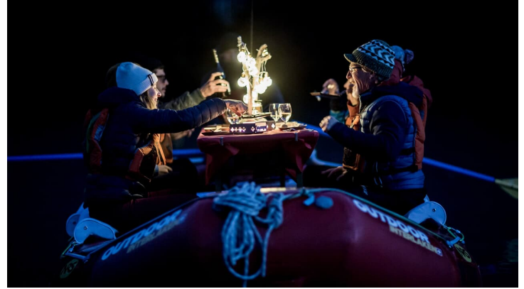
raclette-rafting-outdoor-interlaken-chillipictures-vorne.jpg