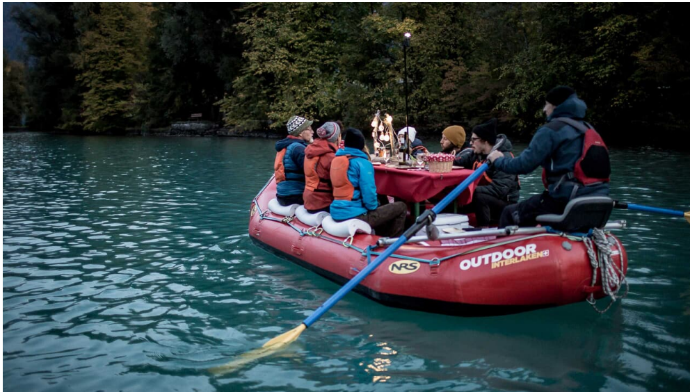
raclett-rafting-outdoor-interlaken-unterweg-aarekanal-interlaken.jpg

16. September - 30. April / abhängig von Wetter & Wasserstand