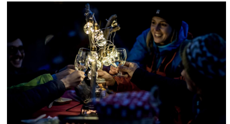
raclette-rafting-outdoor-interlaken-chillpictures-nacht.jpg