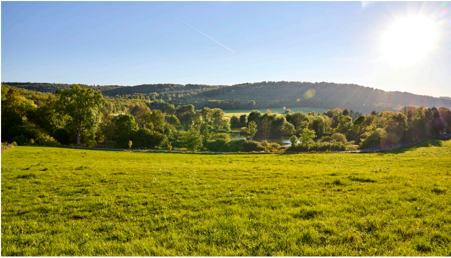
Gaststätte Reitling im Elm - © Anna Meurer