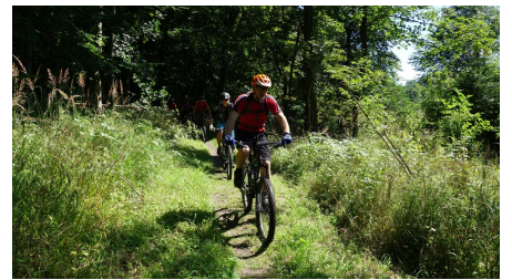
Trail ins Reitlingstal