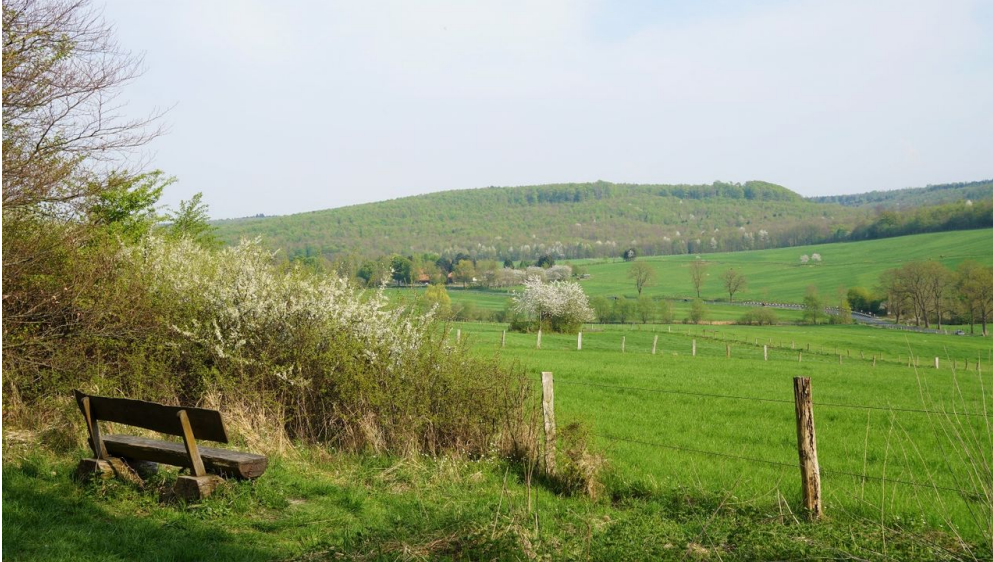
Blick ins Reitlingstal