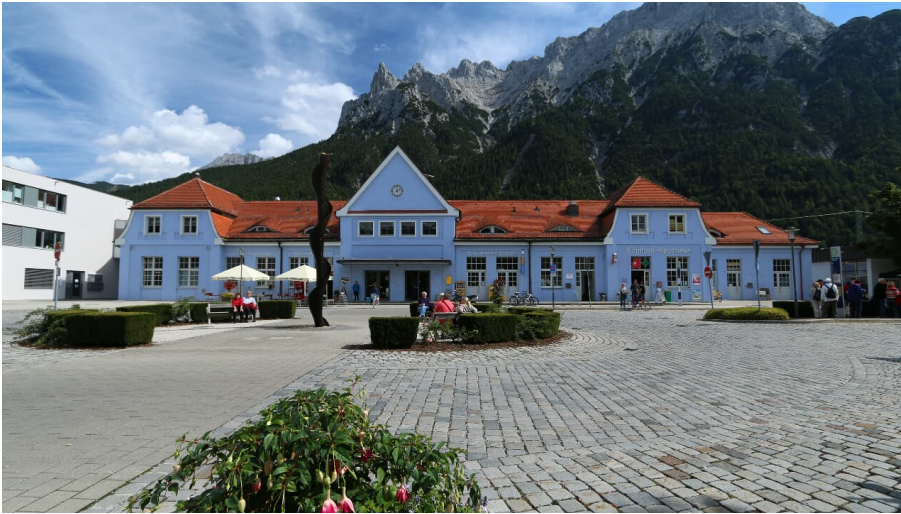
Bahnhof in Mittenwald