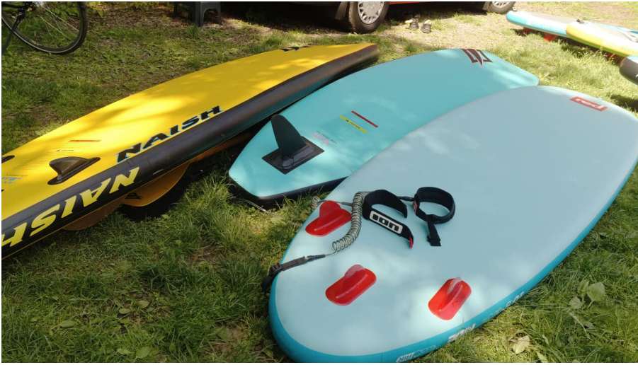
Stand Up Boards