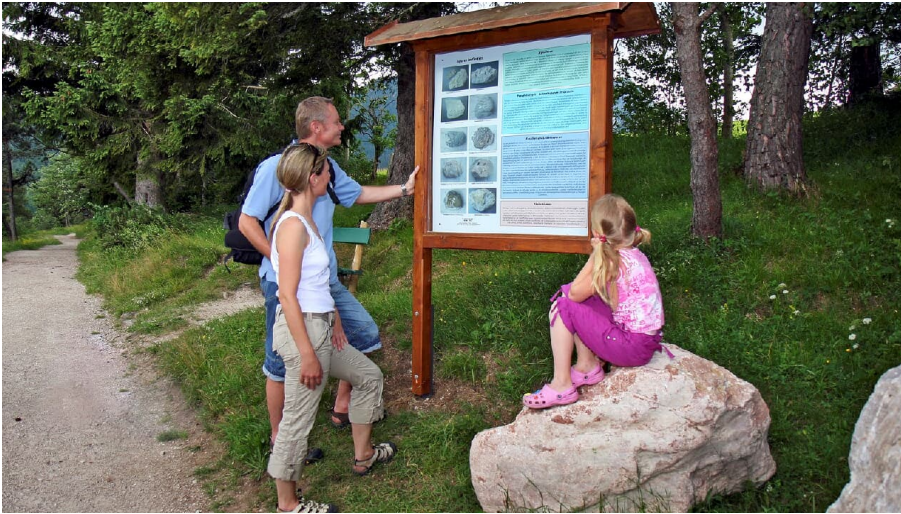
Geologielehrpfad in Mittenwald am Kranzberg