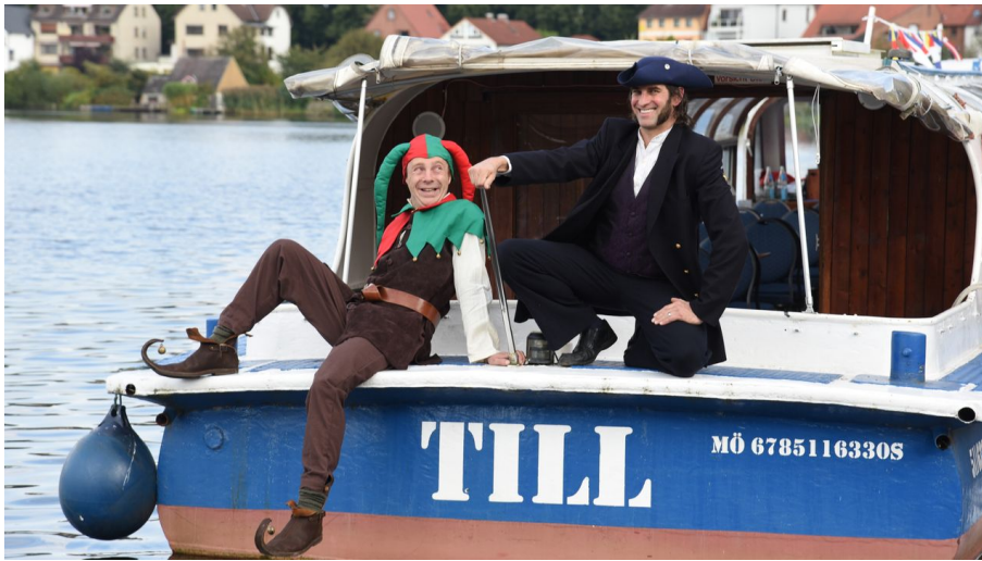
MS-Till - © Mölln-Tourismus - photocompany