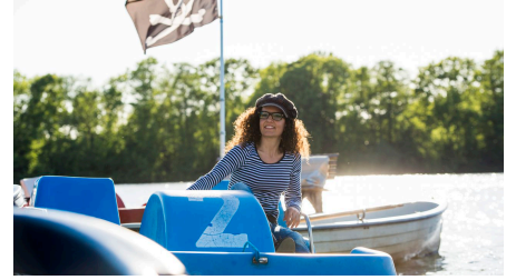
Tretboot-Jens König