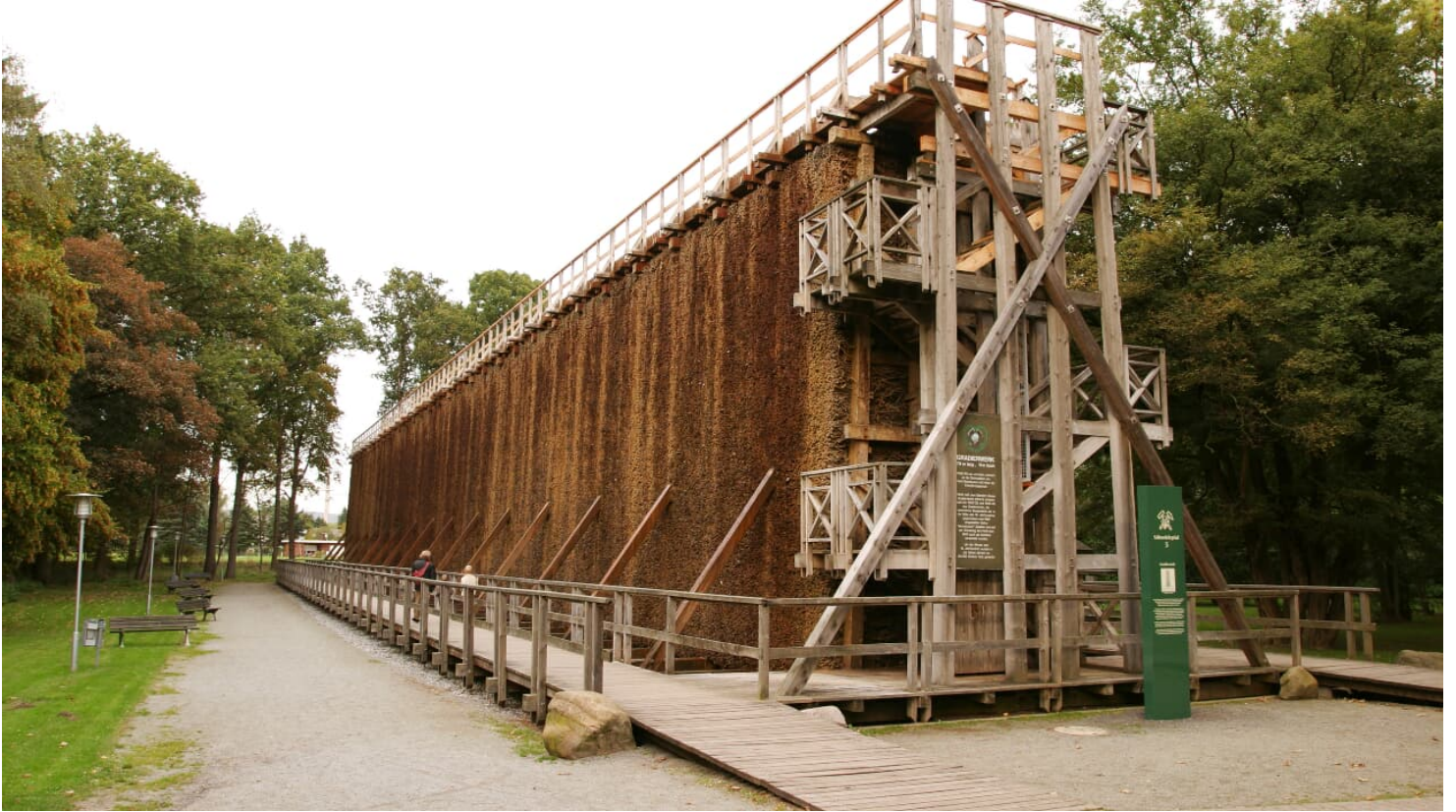
Gradierwerk im Sielpark