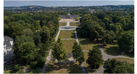
Kurpark Luftbild.jpg