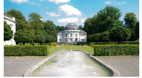
Theater im Park.jpg