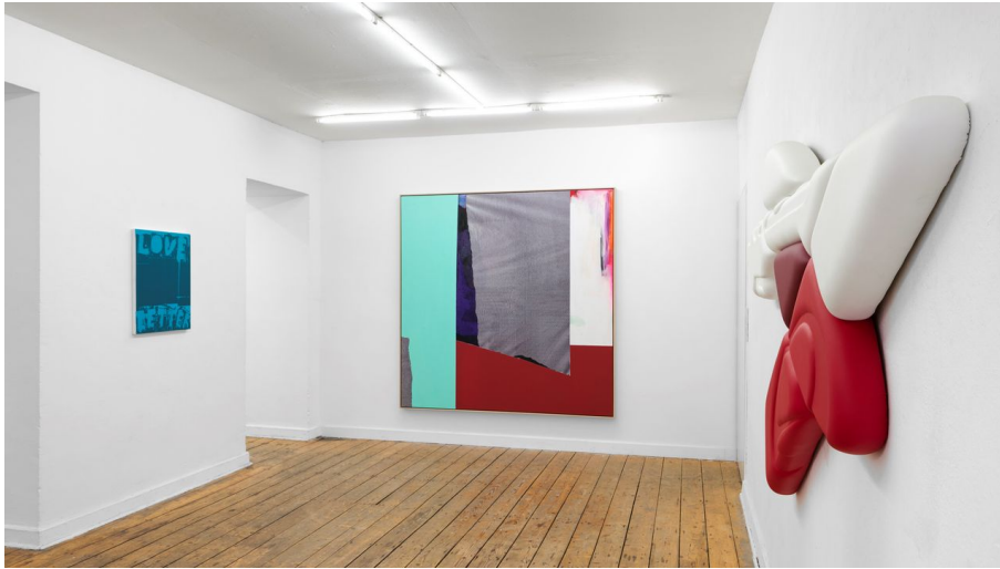
Ruttkowski-68_2.jpg - © Ruttkowski;68