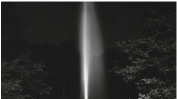
Jordansprudel bei Nacht, R. Langer, StABO.jpg