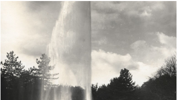
Jordan-Sprudel mit Graf Luckner, StABO.jpg