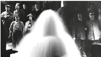
Jordansprudel Brunnenkopf Erbohrung, 1926, Richter, StABO.jpg