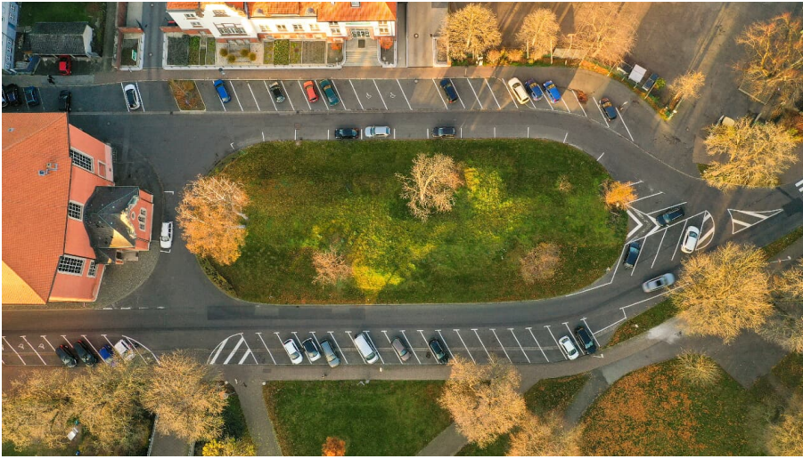
Parkplatz Landeshuter Platz