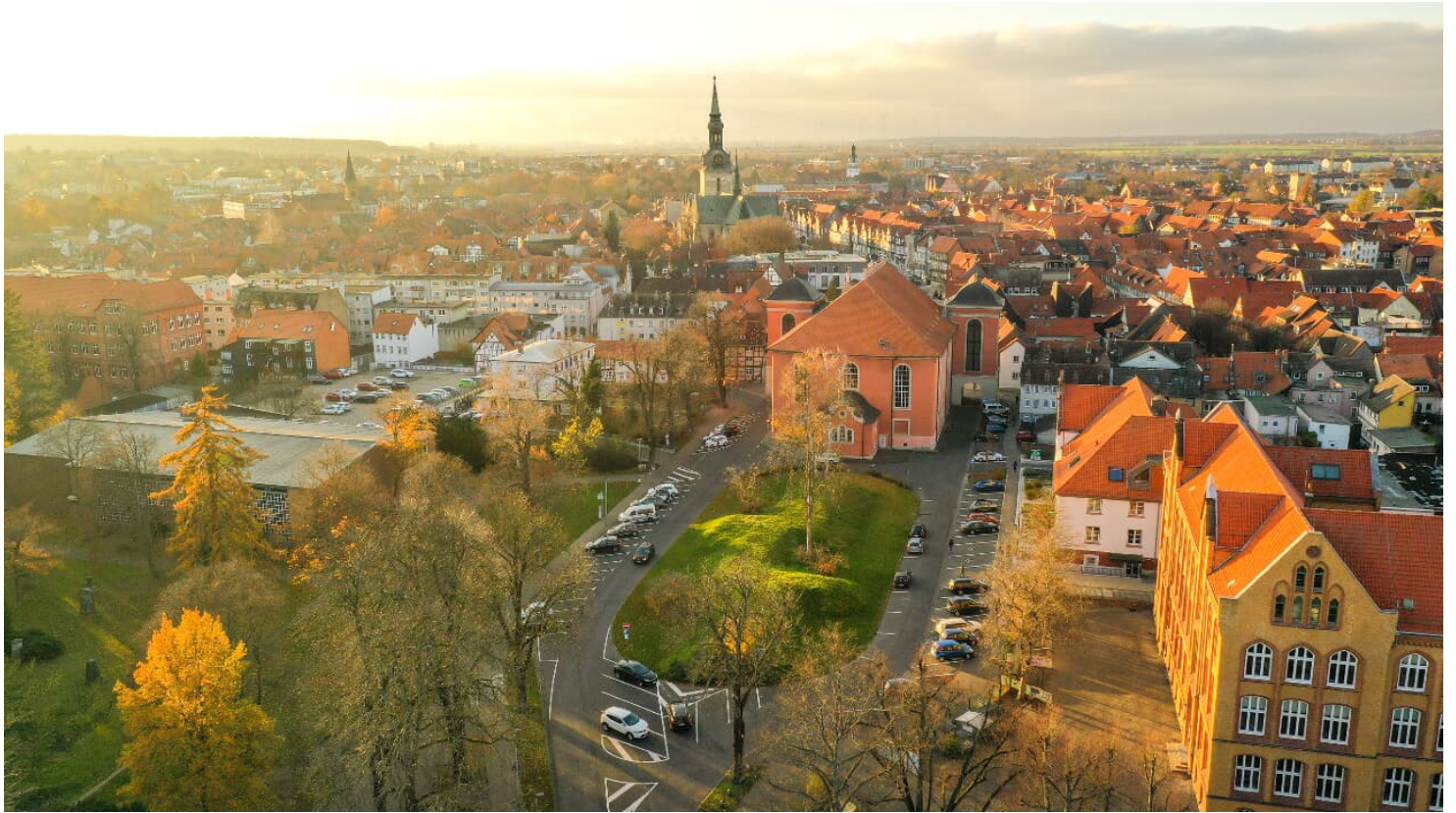
Parkplatz Landeshuter Platz-1