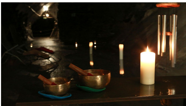
114A7127.jpg - © Susanne Müller, Bild Anja Estepp