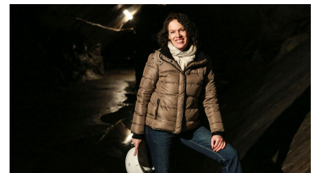
114A7067.jpg - © Susanne Müller, Bild Anja Estepp