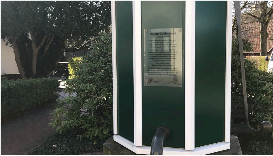
Westerstedde _ Stadtrundgang _ Philippsbrunnen.jpg