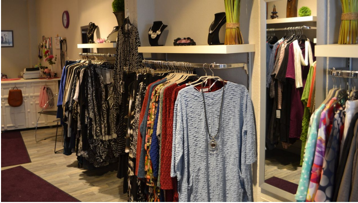
Fashion and More One Size