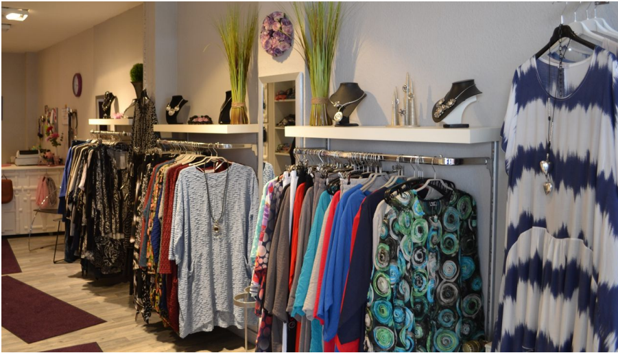
Fashion and More Mölln - © Mölln Tourismus Monika Siegel