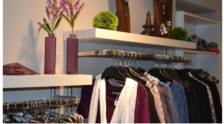
Fashion and More Lagenlook