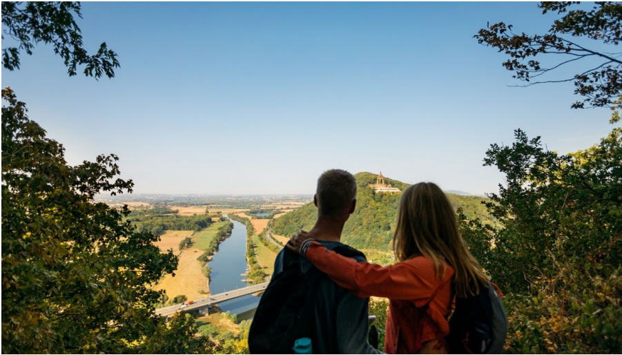
Ausblick Porta Kanzel