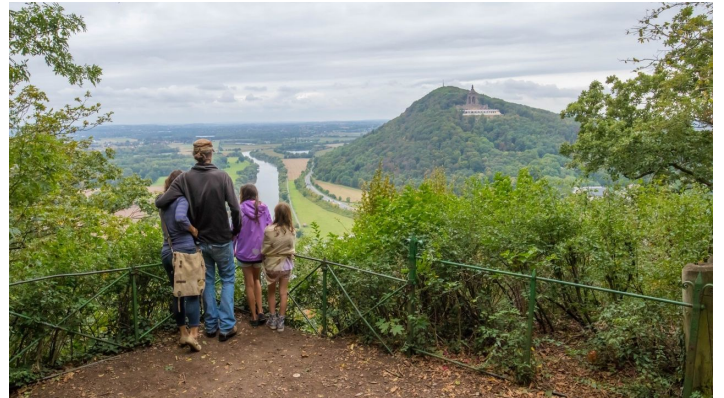
Aussicht Porta Kanzel auf das Kaiser Wilhelm Denkmal