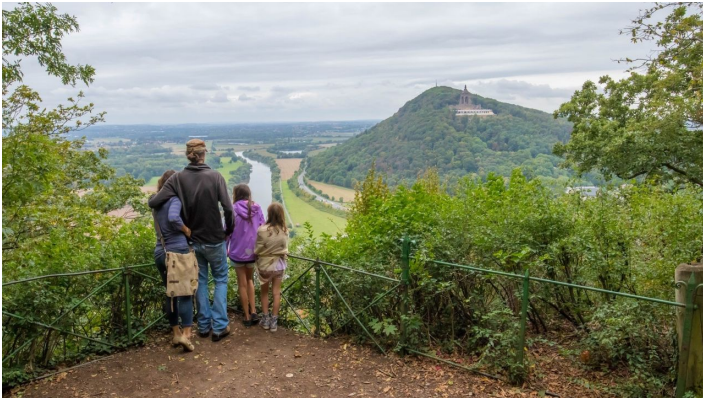
Aussicht Porta Kanzel auf das Kaiser Wilhelm Denkmal